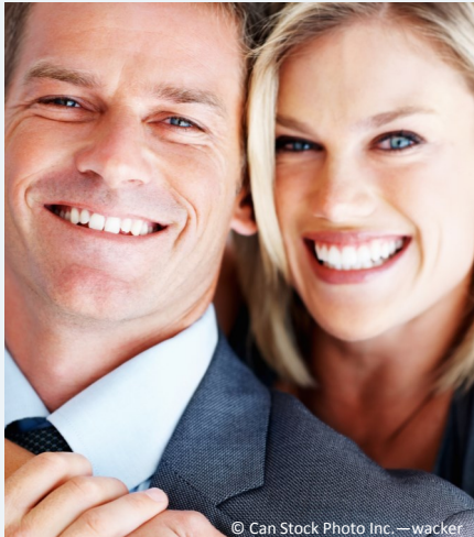
Selbstsicher mit gepflegten Zähnen

Dann werden Mund, Zähne und Zahnfleisch untersucht. Die Zahnbeläge werden angefärbt, um sie besser sichtbar zu machen und es wird die Tiefe der Zahnfleischtaschen gemessen.