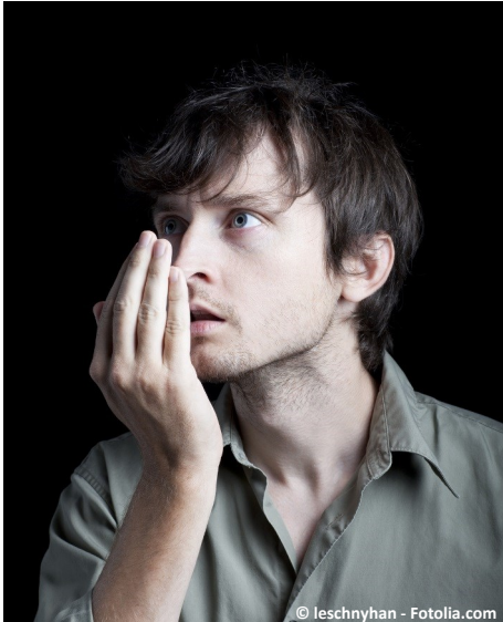
Mundgeruch kann unsicher, gehemmt und einsam machen ...

Fühlen Sie sich manchmal anderen gegenüber gehemmt?