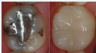
Bedenkliches Amalgam (links) oder verträgliche und ästhetische Füllungen aus Komposit oder Keramik (rechts)?

Als Kassenpatient haben Sie die Wahl zwischen Amalgam und kurzlebigen Kunststoff-Füllungen. Wenn Sie eine dauerhaftere und schönere Lösung wollen, sollten Sie sich für Kompositfüllungen oder für Keramikinlays entscheiden.