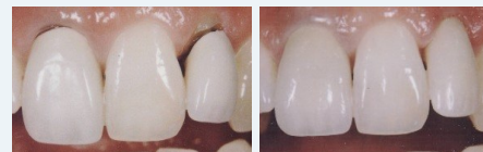
Metallkeramik-Kronen mit dunklen Rändern (links) und ästhetische Kronen aus reiner Keramik (rechts).

Wenn Sie wirklich schöne Zähne wollen, sollten Sie sich für Kronen und Brücken aus reiner Keramik entscheiden.